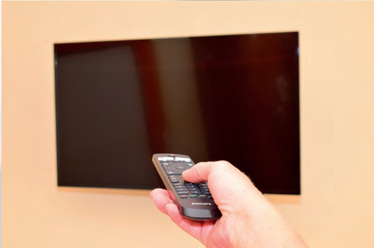
Modernes TV- Entertainment