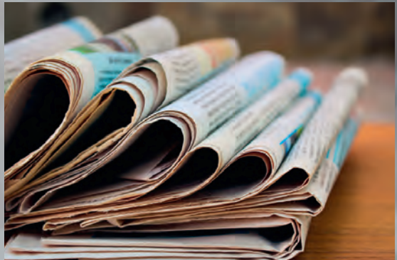
Zeitungen und Zeitschriften nach Wunsch