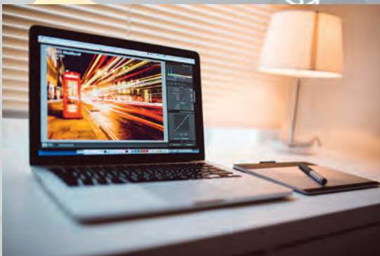
Für Ihre Verbindung: kostenloser WLAN-Zugang