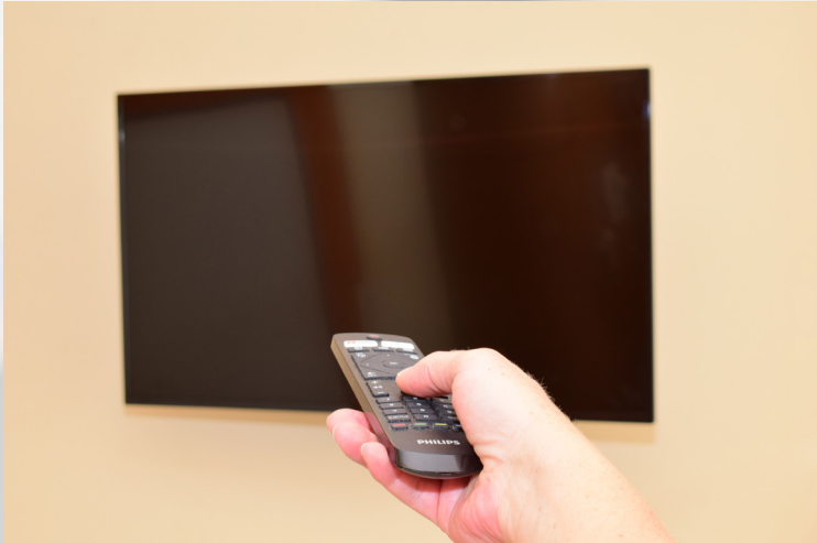
Modernes TV- Entertainment